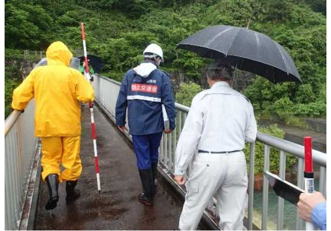
安全利用点検を行う参加者 (常願寺川水辺の楽校)