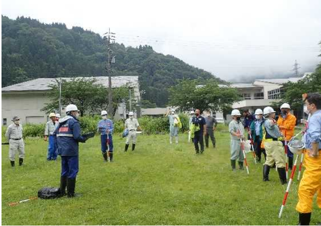
参加者18名での点検箇所・項目の確認 (常願寺川水辺の楽校)