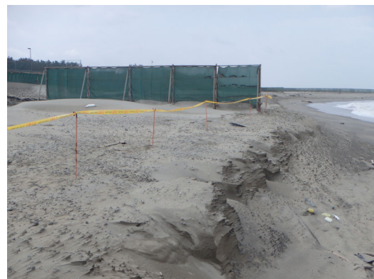
浜崖形成箇所の調査・注意喚起