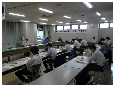
【第25回協議会の様子】

自転車の発生状況の分析、対策の検討・実施を目的として 「金沢自転車ネットワーク協議会」の分科会として平成30年7月に設立。