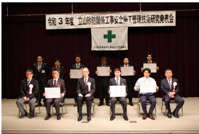
受賞者との記念撮影