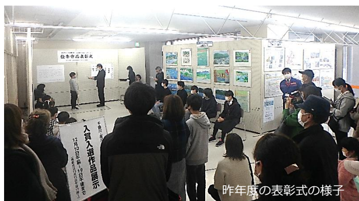
昨年度の表彰式の様子