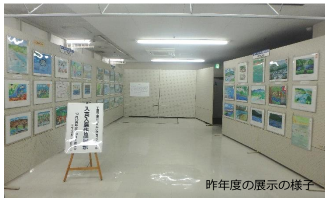
昨年度の展示の様子