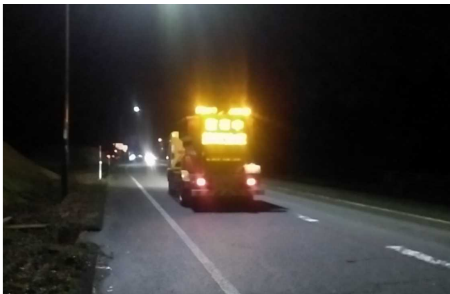
国道8号 小松市林町付近