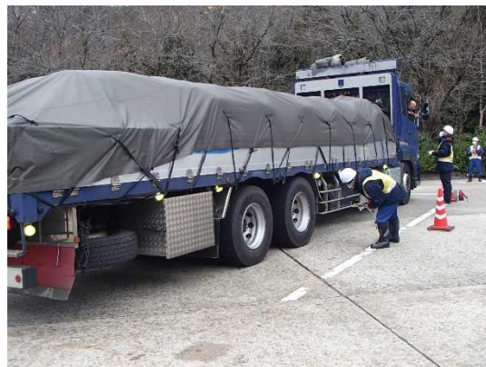
当日の冬用タイヤ装着率調査状況