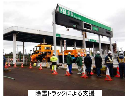
除雪トラックによる支援