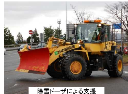
除雪ドーザによる支援