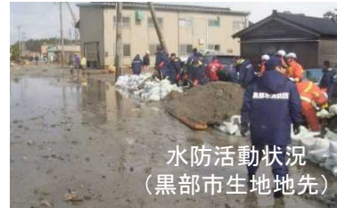
水防活動状況 (黒部市生地地先)