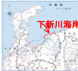
平成20年2月の高波(寄り回り波)災害

下新川海岸水防連絡会は、下新川海岸沿岸における近年で最も甚大な被害をもたらした平成20年2月の高波(寄り回り波)を想定した机上演習を行います。