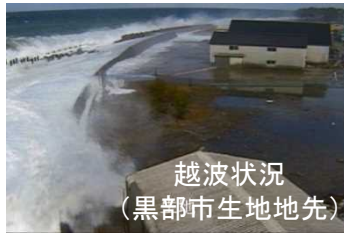
越波状況 (黒部市生地地先)