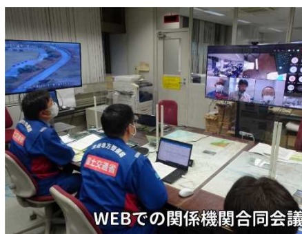
令和3年度演習時の様子（Webを活用した演習）