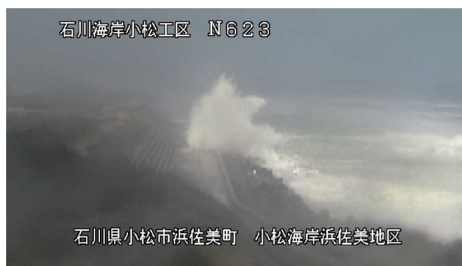
令和3年11月24日 10:00 頃 冬季風浪による越波の様子（小松地区 CCTV カメラによる画像）