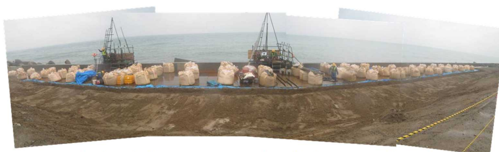
緊急復旧実施のイメージ（上記被災後の緊急復旧事例）