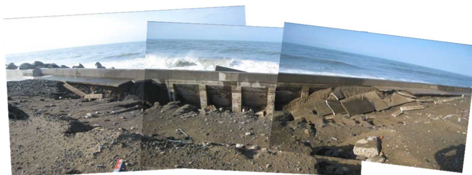
海岸堤防被災のイメージ（平成22年1月 冬季風浪による小松地区の被災事例）