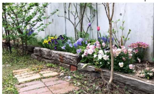
園芸用資材として、ご利用頂けます。