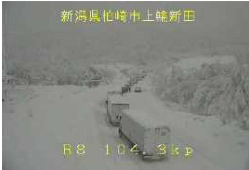
車両の滞留 ＜国道8号＞