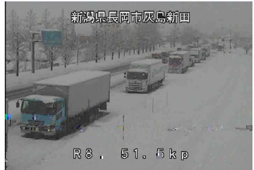
車両の滞留 ＜国道8号＞