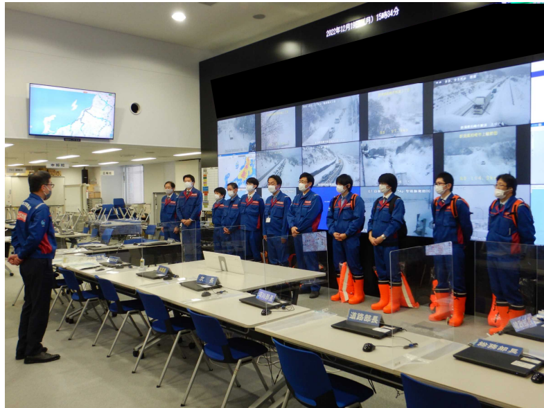
TEC-FORCE（現地活動班）の出発式