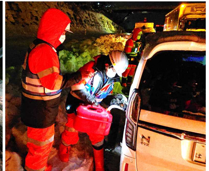
TEC-FORCEの活動の様子 （滞留車両への給油活動）