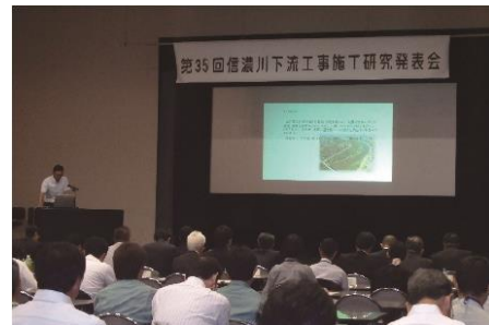
昨年度の工事施工研究発表会 （R2.9.29）

信濃川下流河川事務所と工事受注者で組織する信濃川下流工事安全対策協議会が主催し、施工技術力の向上を目的として工事施工事例等を発表し情報交換を行うことを目的としています。 本発表会で令和2年度に完成した工事の中から応募された19題の論文のうち、6題の発表を行い、投票により優秀賞を決定し表彰いたします。