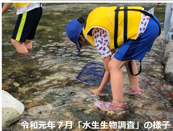
令和元年7月「水生生物調査」の様子