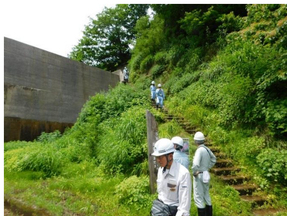
梅花皮沢第4号砂防堰堤 点検状況