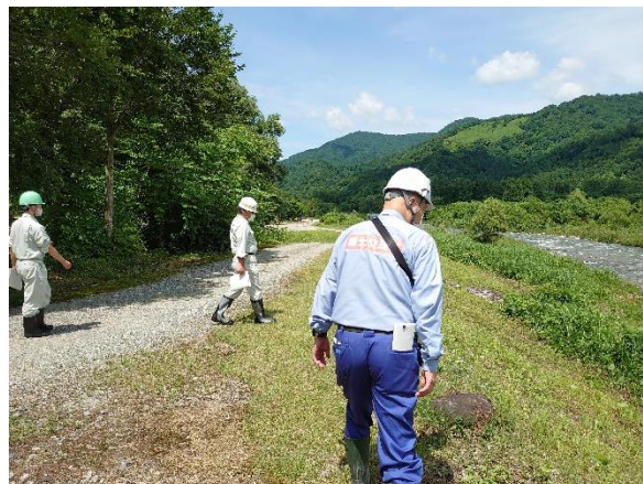
荒川流路工 点検状況