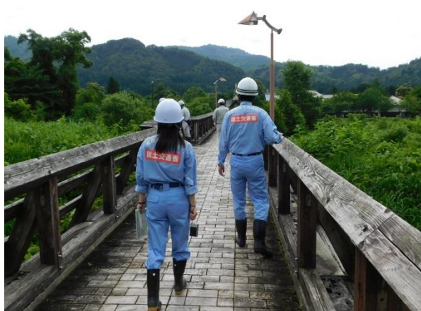
荒川流路工付近（かじか橋） 点検状況