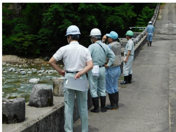
玉川スーパー暗渠砂防堰堤 点検状況