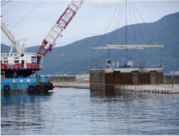
①ケーソン移動準備（浮上）作業