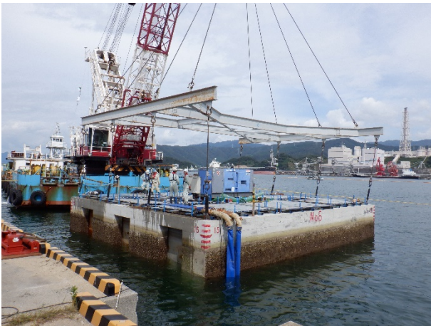
③ケーソン据付（進水）作業