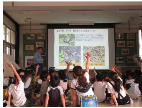
（令和元年「水生生物調査」の様子）