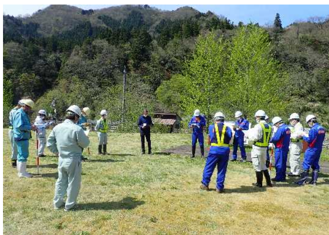
参加者15名での点検箇所・項目の確認 (常願寺川水辺の楽校)