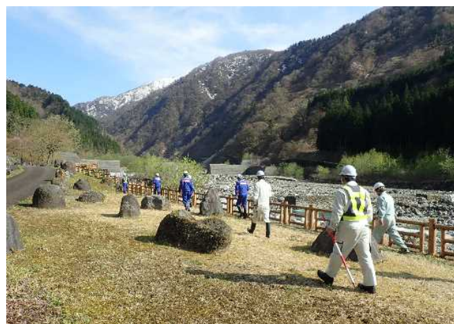
安全利用点検を行う参加者 (千寿ヶ原緑地公園)