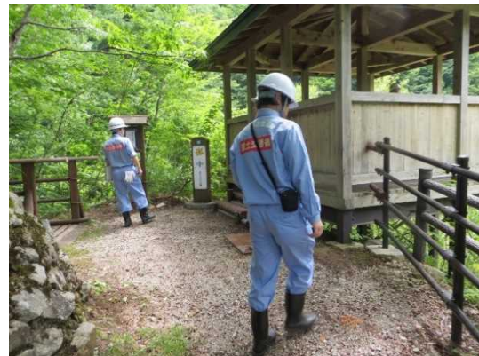
昨年の夏休み前安全利用点検状況