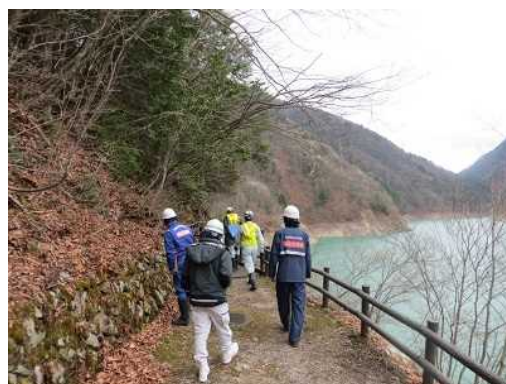
④ダム右岸管理用巡視路