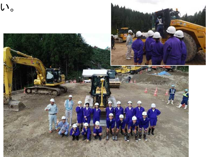
平成30年度の見学会の状況

※雨天の場合は、順延となります。開催の有無は、当日の朝 8:30以降に下記までお問い合わせ下さい。