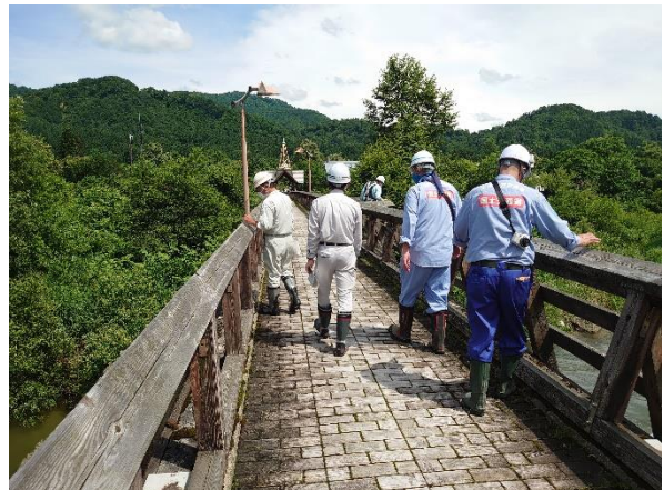
荒川流路工付近（かじか橋） 点検状況