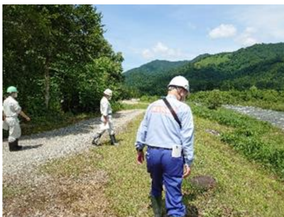
荒川流路工 点検状況