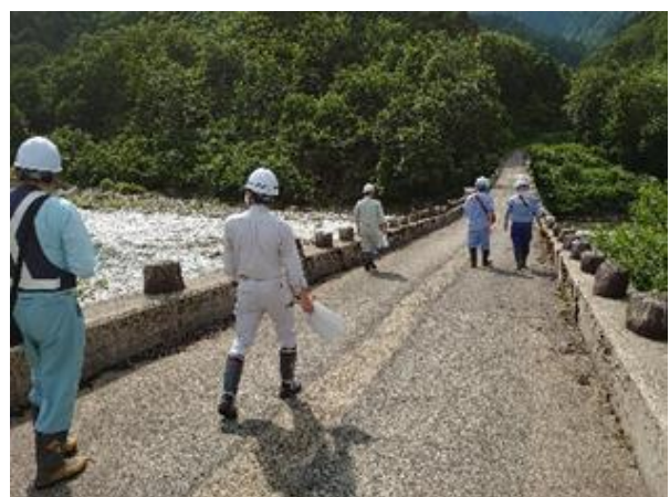
玉川スーパー暗渠砂防堰堤 点検状況