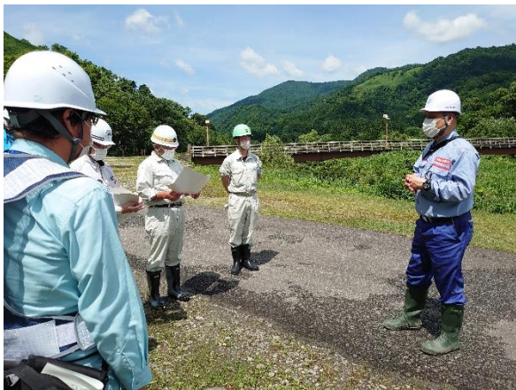
点検前ミーティング状況