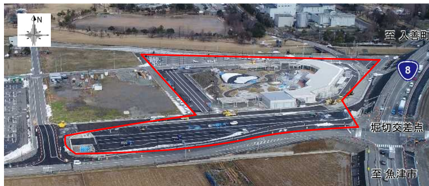
道の駅「KOKOくろべ」工事状況（R4.1.6撮影）