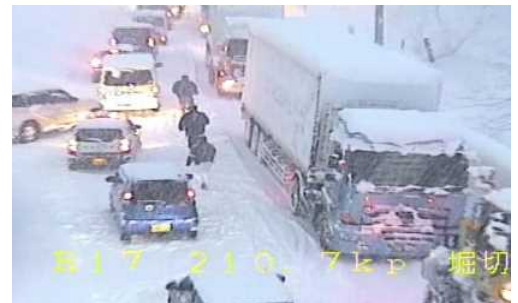
昨年の大雪(令和2年12月16日) 湯沢町湯沢(ゆざわまち ゆざわ)