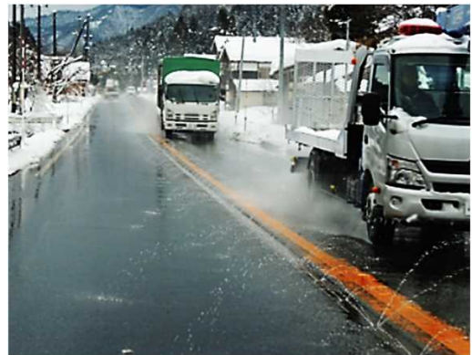
消雪パイプの稼働状況【イメージ】