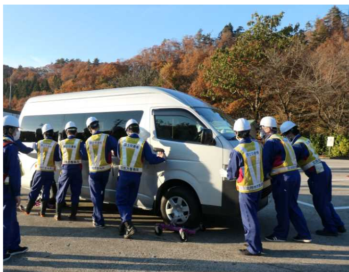
災害対策基本法に基づく車両移動訓練の様子