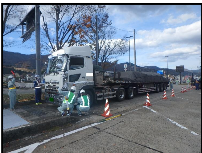
車両の寸法を計測しています。