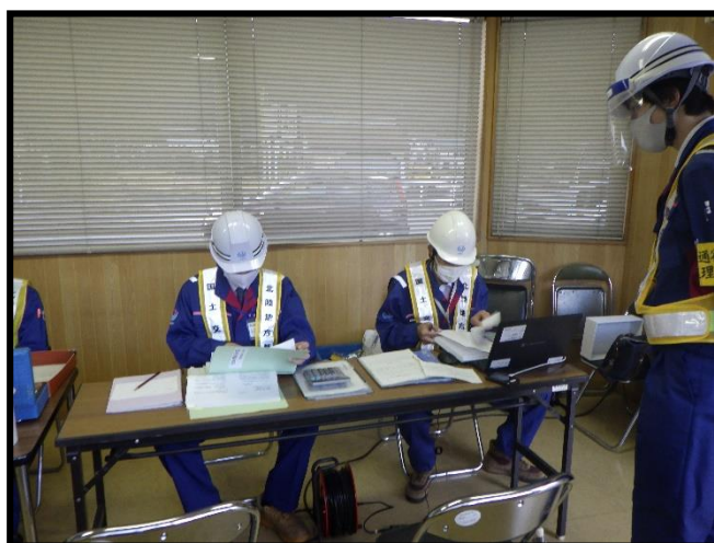
特殊車両通行許可証の内容を確認しています。