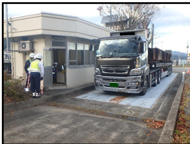
車両の重量を計測しています。