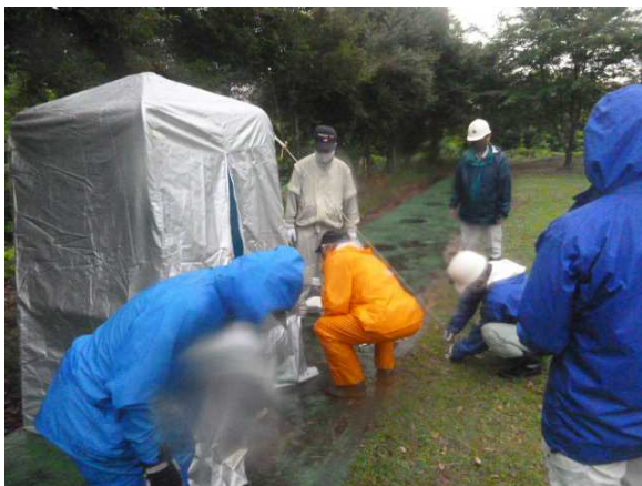
【非常用トイレの組み立て】 非常用トイレの組み立て方法を 確認し、設営訓練を実施