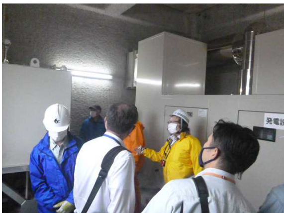
【非常電源用発電機の説明】 長岡国道事務所の職員による 非常電源用発電機の説明