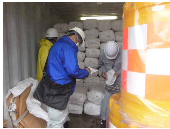
【災害用保管資材の確認】 保管庫の資材をリスト表と照合し点検