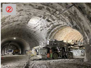
②利賀トンネル、河床進入トンネル交差点