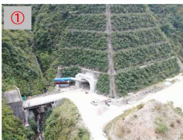
①利賀トンネル坑口