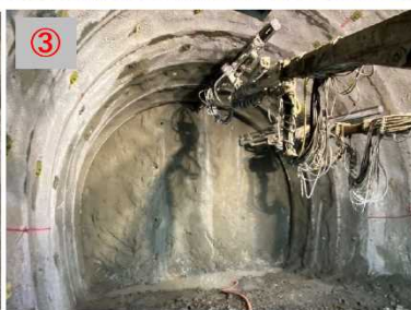
③河床進入トンネル掘削状況