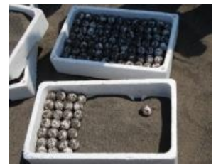
希少種保護 (ウミガメ卵の保護)