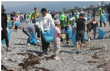
海岸環境の維持 (清掃活動)