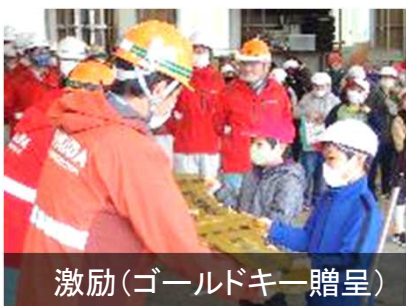
激励(ゴールドキー贈呈)