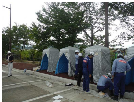
【非常用トイレの組み立て】