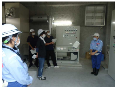
【非常電源用発電機の起動操作の説明・Ku-SATの紹介】 長岡国道事務所の職員による非常電源用発電機の起動操作と Ku-SAT使用方法の説明