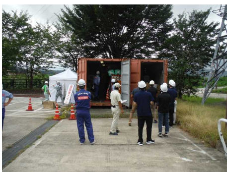
【災害用保管資材の確認】 保管庫の資材をリスト表と照合し 1つ1つ点検