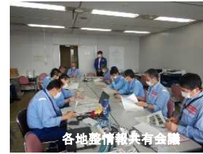
各地整備情報共有会議