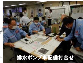
排水ポンプ車配備打合せ