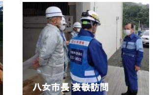
八女市長 表敬訪問