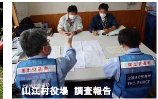
山江村役場 調査報告