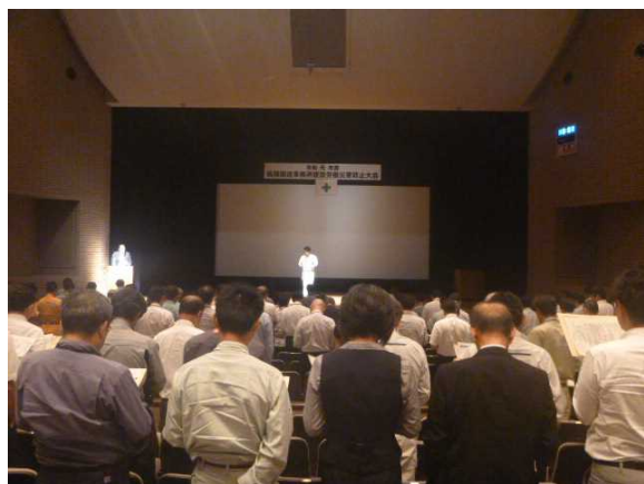
昨年度の建設労働災害防止大会(安全宣言)