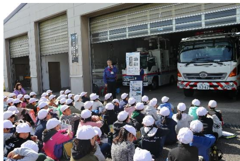
写真上下: 昨年の横越小学校での出前授業の様子