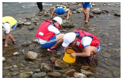
川にすむ生きものを採集