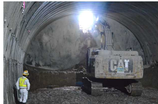
柏崎トンネル貫通