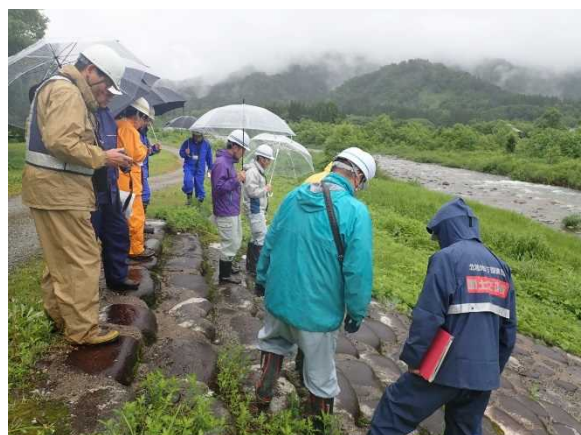
荒川流路工 点検状況