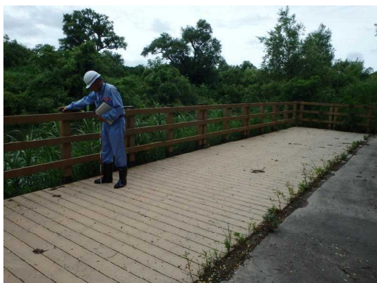
前回の点検実施状況(河川)