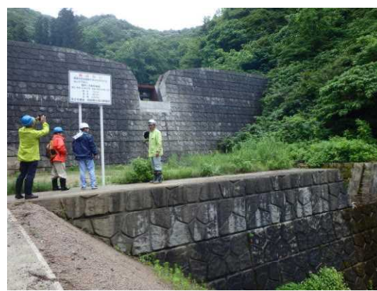
前回の点検実施状況(砂防)