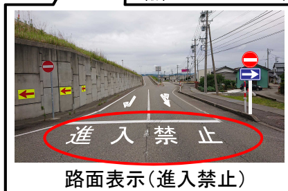
路面表示(進入禁止)