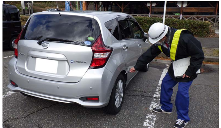
R2. 12. 7 調査状況