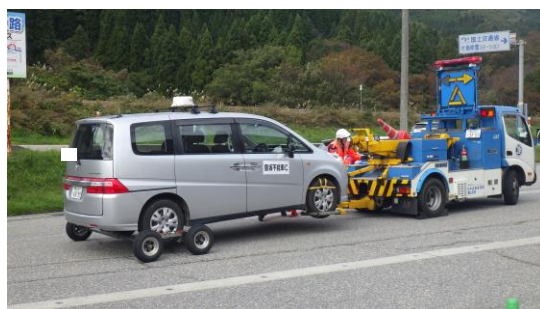
▲レッカー車で一般車両を牽引

※報道や取材を希望される方は、事前に下記まで事前に連絡の上、現地へお越しください。（駐車場は用意しています。） また、今般の情勢を鑑み、検温・記帳・マスク着用をお願いします。