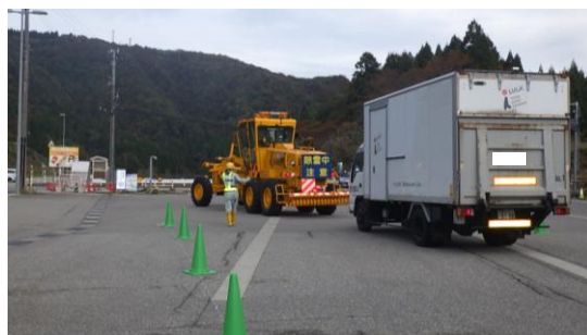
▲除雪車でトラックを牽引