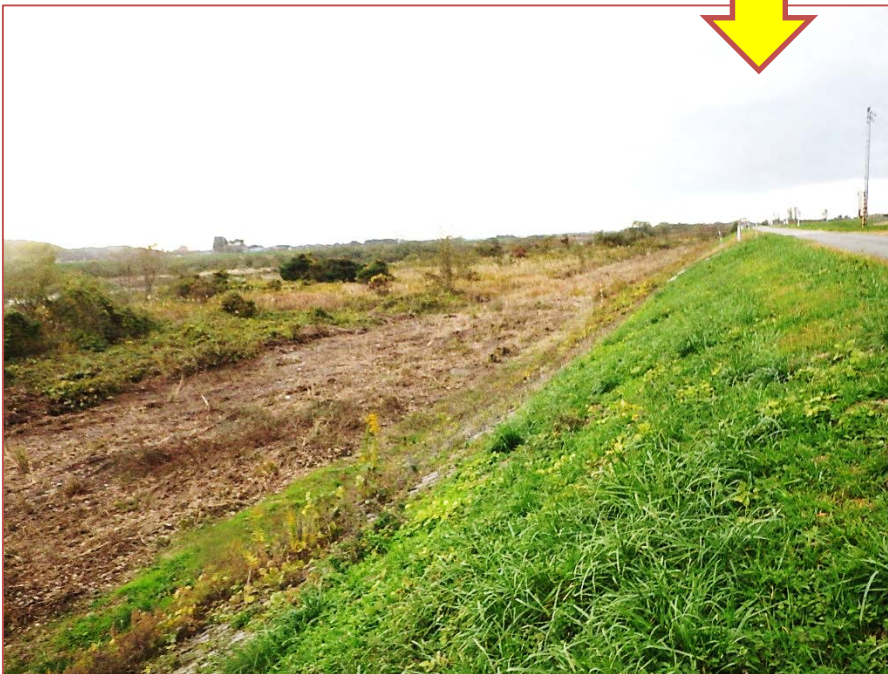
藪刈り実施後 (村上市小岩内付近)