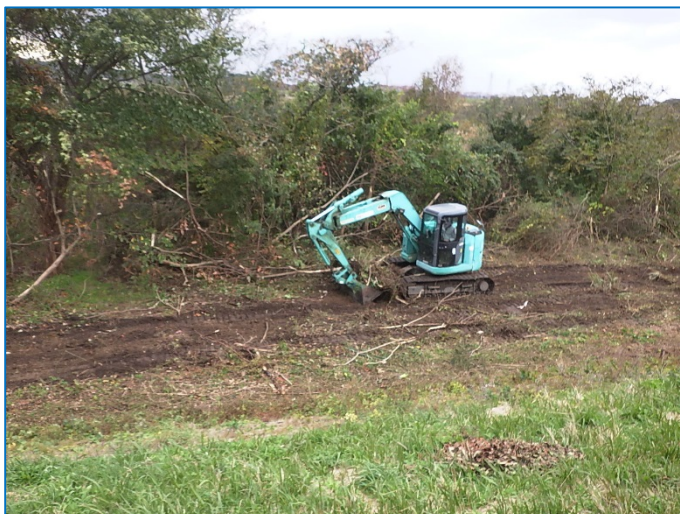
伐開作業中 (村上市川部付近)