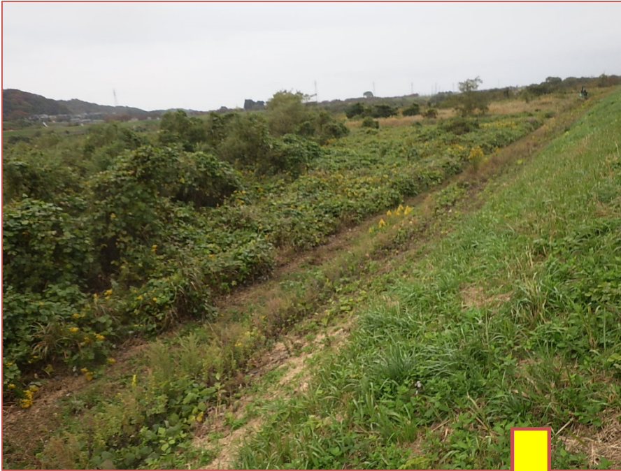
藪刈り実施前 (村上市小岩内付近)