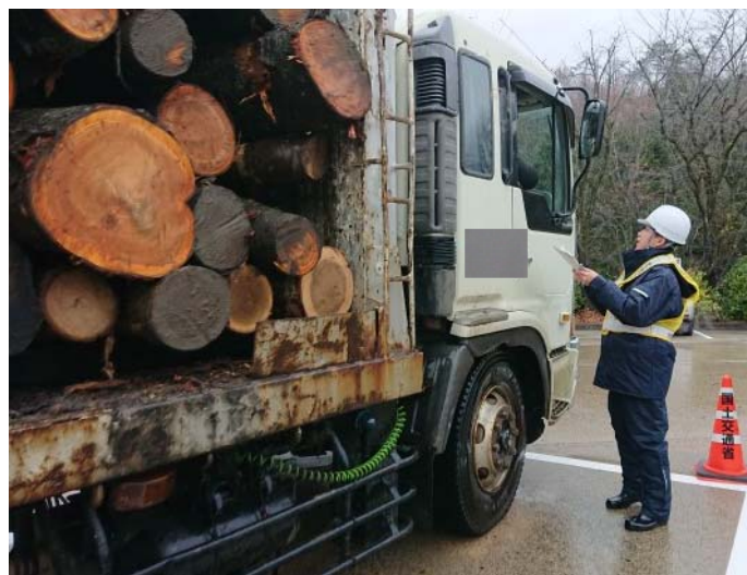
車両誘導訓練及び啓発活動の様子