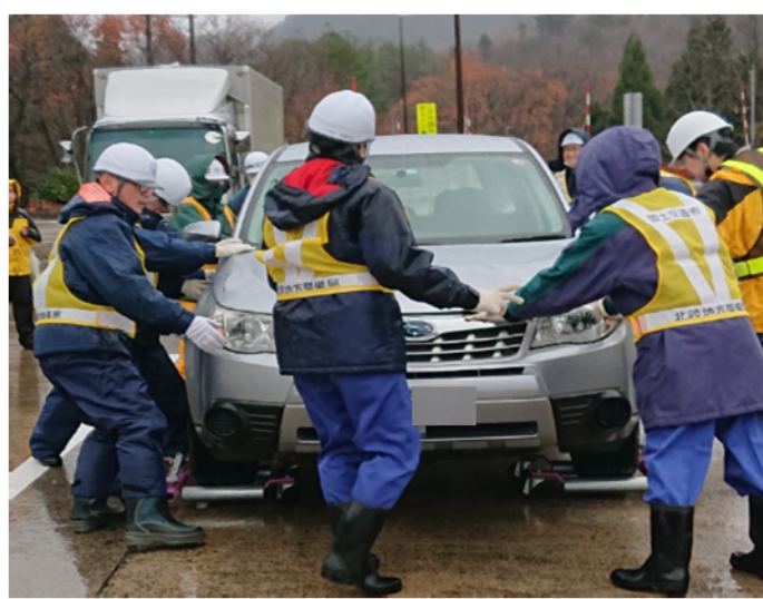
災害対策基本法に基づく車両移動訓練の様子