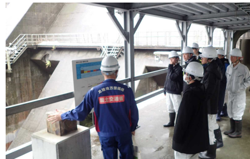
令和元年度の実施状況 （ダム排砂ゲート設備見学）