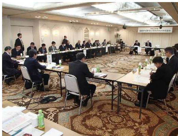
令和元年度 北陸地域港湾の事業継続計画協議会の状況