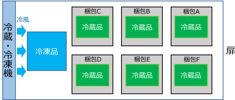
コンテナ内での混載イメージ (上面図)