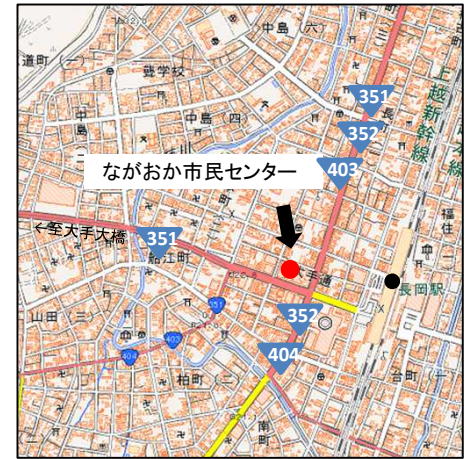
ながおか市民センター