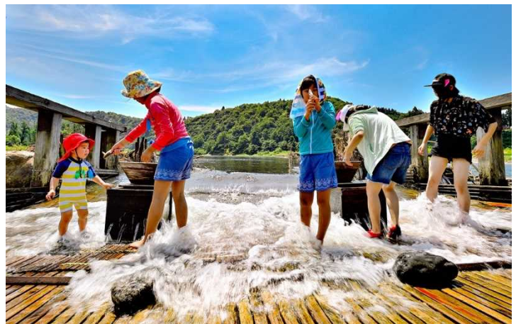
グランプリ 信濃川中流及び魚野川部門 最優秀賞 「取れたて」