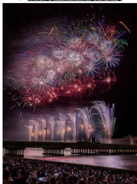
「大河に咲く」 堀 利治 (ほり としはる)