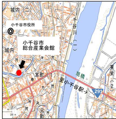
小千谷市総合産業会館サンプラザ