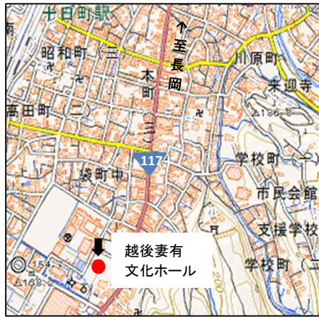
越後妻有文化ホール「段十ろう」