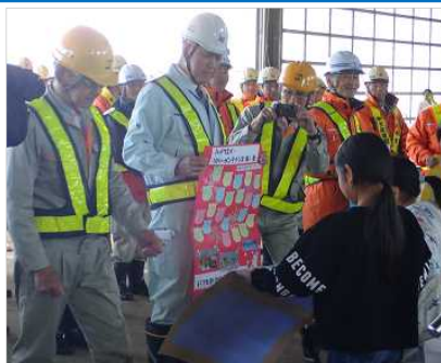
小学生から業者さんへの激励