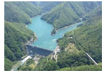
大町ダム（長野県大町市）