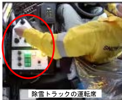
除雪トラックの運転席 熟練オペレータの機械操作技術