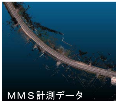
MMS計測データ 自動化に必要な地図データ