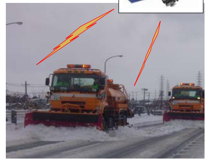
多岐にわたる作業装置を自動化 人間は運転操作するだけ