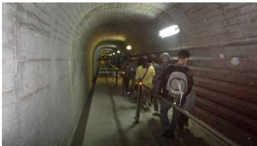
マット部に向かってダム内部の階段を移動