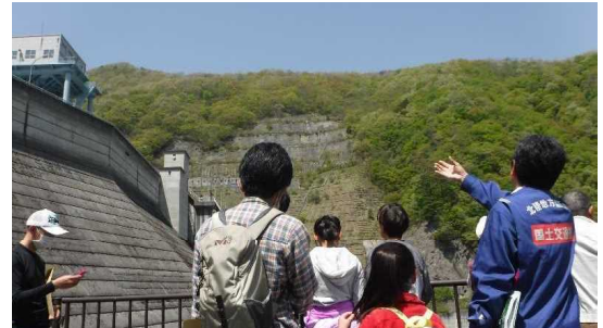
ダム直下流で見学